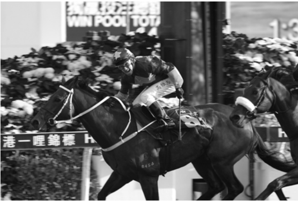
「幸運馬主」在高雅志力策下，以半個馬位之先攻下 2003 年香港一哩錦標(一級賽)，另一香港賽駒「祝福」則取得亞軍。